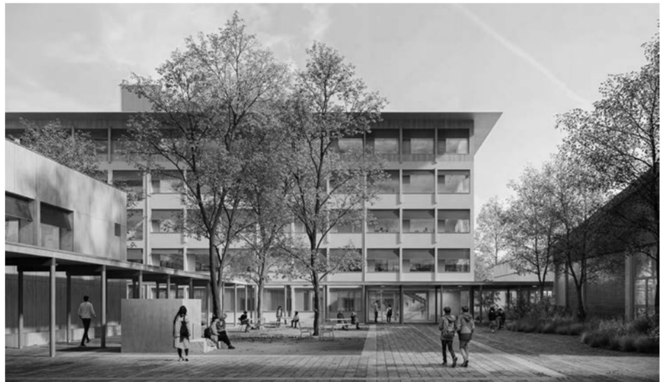
So soll das Schulhaus einst aussehen.

Die Schülerinnen und Schüler helfen tatkräftig mit. Seit den Osterferien misten sie aus und werden vor den Sommerferien bereits kleinere Waren zügeln. Der grosse Umzug soll Ende September, kurz vor den Herbstferien, stattfinden. Nach den Herbstferien findet der Unterricht dann vollständig in den Provisorien statt. Abgeschlossen werden die Zügelarbeiten, indem die Schülerinnen und Schüler dann ihren eigenen Stuhl ins Provisorium tragen – als sichtbaren Auftakt in eine neue Ära.