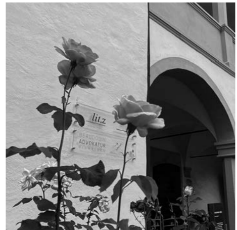
Lit.z-Stammsitz ist die Rosenburg.