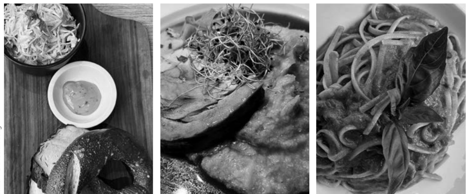
Dreimal Menü 1: (v.l.) Café 54, Melachere, Primo Piano.