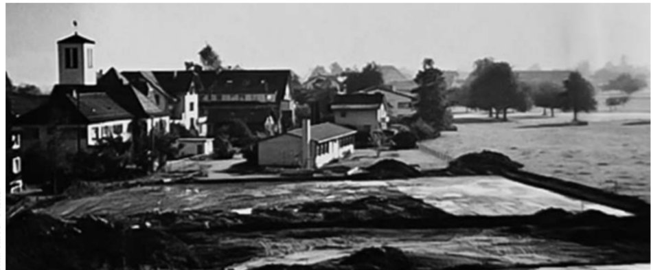
So sah der Pestalozzi-Platz früher aus.

Auf dem Schulgelände Pestalozzi sind noch keine Lastwagen, Bagger oder Kräne zu sehen, und doch läuft die Gesamterneuerung des Oberstufenzentrums bereits auf Hochtouren. Im Hintergrund werden weitere wichtige Entscheidungen getroffen. So konnten die Arbeiten für die Baupiste und für das Provisorium bereits vergeben werden. Das Provisorium wird hinter der Turnhalle aufgestellt. Auf dem Rasenplatz befindet sich dann der Installationsplatz mit Umschlagplätzen, Materiallager und Baubaracken. «Der Zugang zu den Provisorien ist über den Pestalozzi-Weg, den Parkplatz sowie entlang des Schwimmbads möglich», sagt Hubert Rüttimann, immobilienverantwortlicher Gemeinderat. Ebenso werden laufend Ausschreibungen gemacht und erste Offerten geöffnet. «Es ist erfreulich, dass die Provisorien günstiger sind, als im Kostenvoranschlag angenommen», ergänzt Hubert Rüttimann. Auch der Prozess der Baugenehmigung ist schon in vollem Gange. Der Pestalozzi-Saal wird während