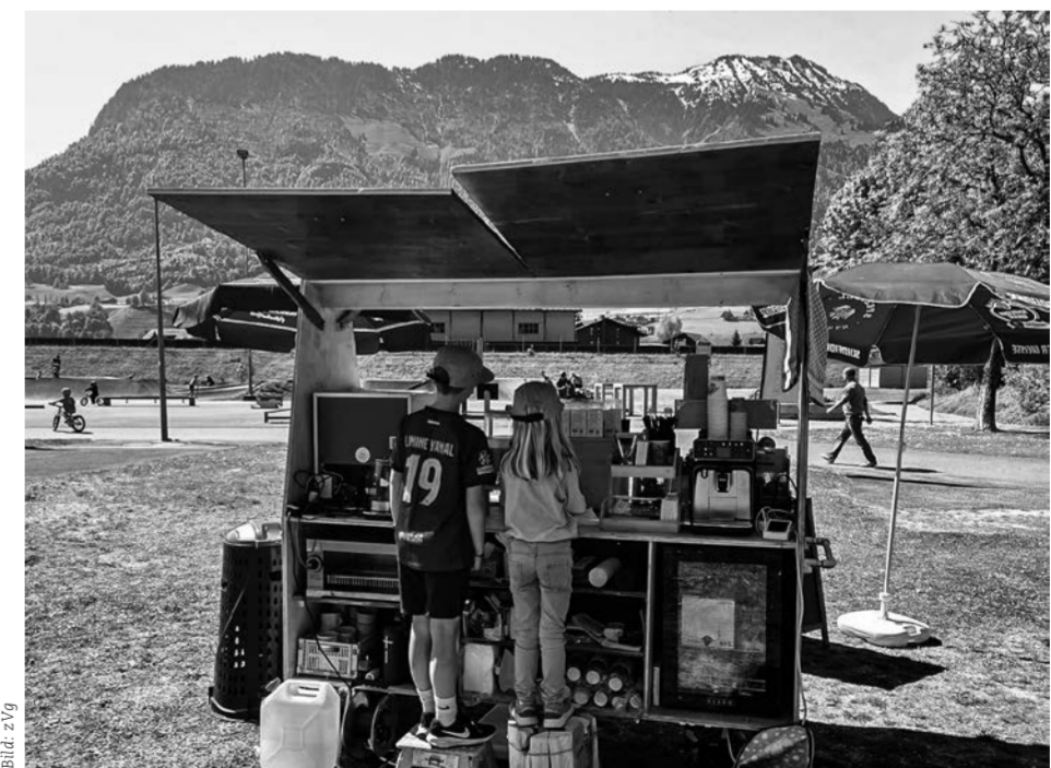
Eichli-Lädeli: mit Jugendlichen für Jugendliche.

Von Beginn an war das Ziel klar definiert: Jugendlichen eine niederschwellige Anlaufstelle zu bieten, sie in ihrer Entwicklung zu unterstützen und ihre Mitwirkung am Gemeindeleben zu fördern. Anfänglich nahm sich ein Verein dieser Aufgabe an, jedoch merkte man rasch, dass professionelle Unterstützung erforderlich war. Nach einer Pilotphase wurde die Jugendarbeitsstelle fest in der