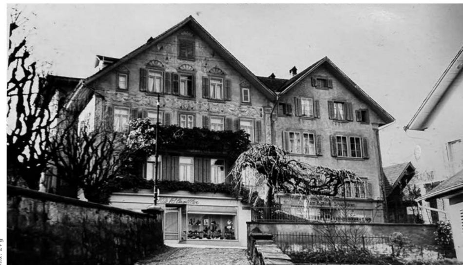
Das Schuhgeschäft Blaettler befand sich bis 1983 eingangs der Nägeligasse.