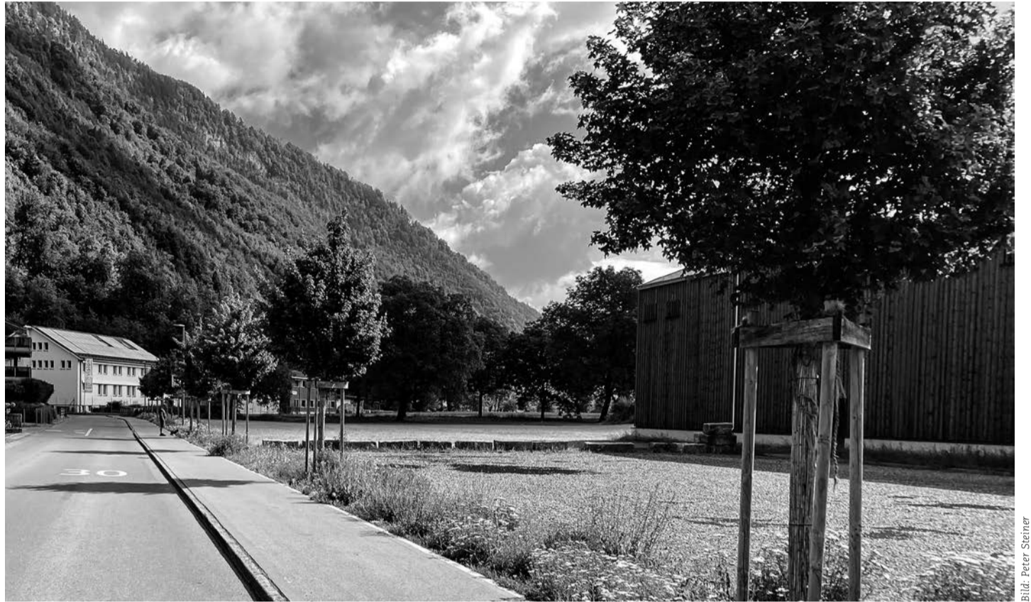
Der Klimawandel erfordert viele Massnahmen, u.a. die Beschattung von Asphaltflächen. Im Bild: Junge Baumreihe im Eichli.

Das Schuhgeschäft Blaettler geht in junge Hände über