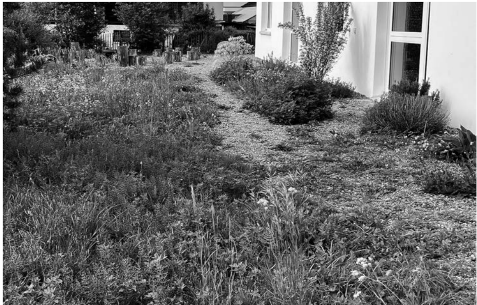
Beispiel einer Ruderalfläche: So soll es auch in Stans bald blühen.