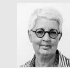
Agatha Flury Lektorat und Korrektorat

Der Nachdruck sämtlicher Artikel und Illustrationen ist unter Angabe der Quelle ausdrücklich erlaubt. Für den Verlust nicht verlangter Artikel kann die Redaktion keine Verantwortung übernehmen.