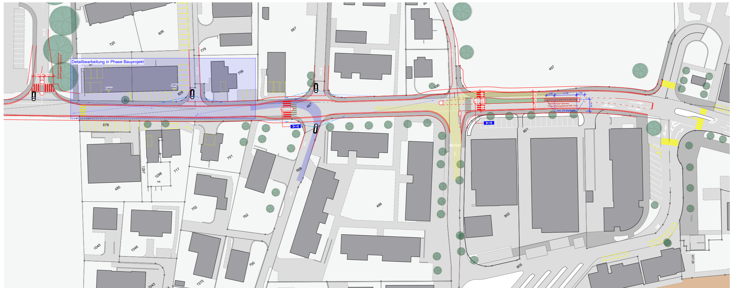
Planausschnitt Gemeindeparkplatz bis Ausfahrt Bahnhof-Parking