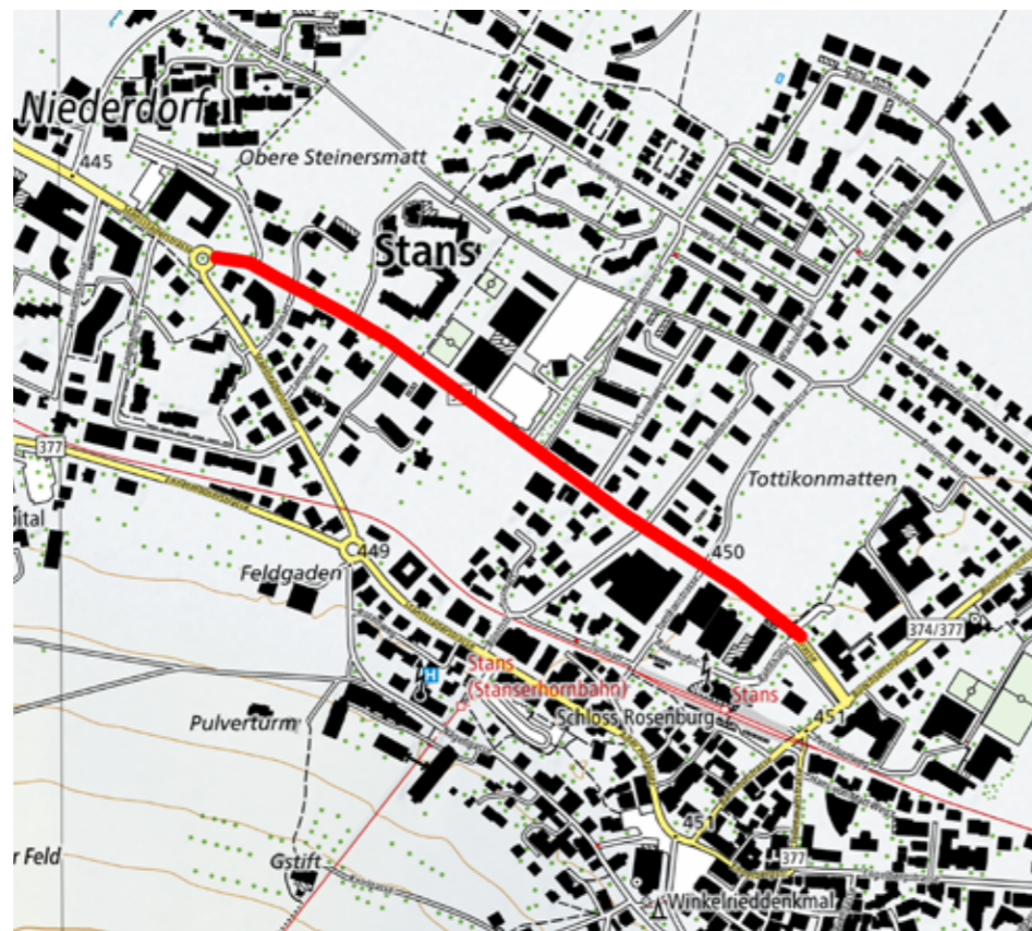
Projektperimeter: Kreisel NKB - Postgebäude

Zudem werden die Fussgängerstreifen mit einer Mittelinsel ausgerüstet. Dies ist bei diesem Verkehrsaufkommen notwendig und erhöht die Verkehrssicherheit und den Verkehrsfluss. Bei der Einfahrt Bahnhof wird zudem ein Mehrzweckstreifen errichtet, der von Velofahrenden bei der Ein- und Ausfahrt genutzt werden kann. Zudem kann damit der Knoten so ausgebaut werden, dass die einfahrenden Busse nicht mehr das Trottoir überschleppen, was heute teilweise zu gefährlichen Situationen führt. Auf den Fussgängerstreifen auf der Höhe Einfahrt Langmatt wird künftig verzichtet. Dieser befindet sich sehr nah beim Fussgängerstreifen Kreisel NKB und Messungen haben gezeigt, dass der Fussgängerstreifen wenig benutzt wird.