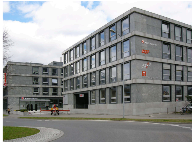
Bild oben: Ansicht von Südosten Bild unten: Ansicht von Südwesten

Um einen U-förmigen Hof geformtes, viergeschossiges Geschäftshaus mit Flachdach und strenger Fassadengliederung. Die um das Gebäudevolumen geführten Lisenen betonen die Geschossigkeit. Die mit Naturstein verkleideten Fassaden werden von den im strengen Rhythmus gesetzten Fenster strukturiert. Der Hof liegt gegenüber dem Strassenniveau etwas erhöht und mutet städtisch an.