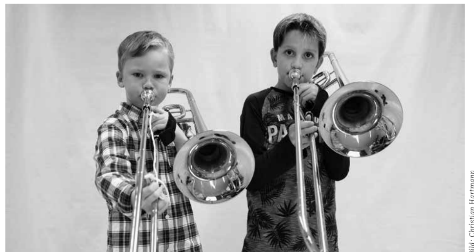
Die Musikschule Stans lädt zum Instrumenten-Parcours ein.