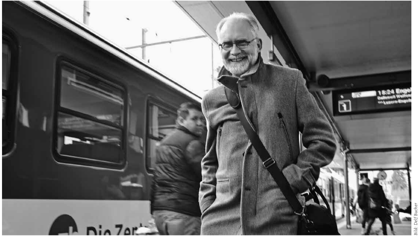
Gemeindepräsident und Pendler Gregor Schwander ist oft am Stanser Bahnhof anzutreffen.