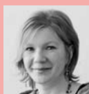
Claudia Slongo Schule/ Kommunikation