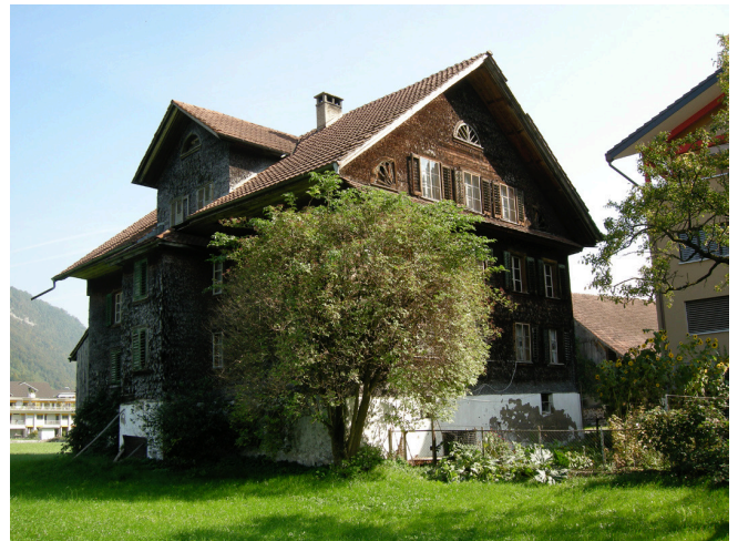
Bild oben: Ansicht von Nordosten Bild unten: Ansicht von Südwesten

Das Haus Hostatt wurde in Blockbauweise erbaut. Auf einem massiven Sockelgeschoss erhebt sich ein zweigeschossiger Holzbau in Mischbauweise unter einem Satteldach. Die im Biedermeierstil gehaltenen Fassaden sind verschindelt und die Fenster finden eine regelmässige Anordnung. Mit seinen vier Zonen-Gliederung (Vorderhaus, mittlerer Erschliessungsteil, Hinterhaus, Kammerzone) weicht der Bau von der bekannten Hausgliederung von Wohnhäusern in Blockbauweise der Innerschweiz ab.