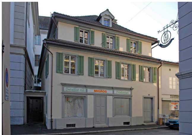
Bild oben: Ansicht von Südwesten Bild unten: Ansicht von Nordosten

Das mit dem Leuw-Haus zusammengebaute ehemalige Bürgerhaus ist fein verputzt und steht unter einem Walmdach. An der Nordfassade ist eine breite Laube angebracht mit laubsägeartigem Geländer.