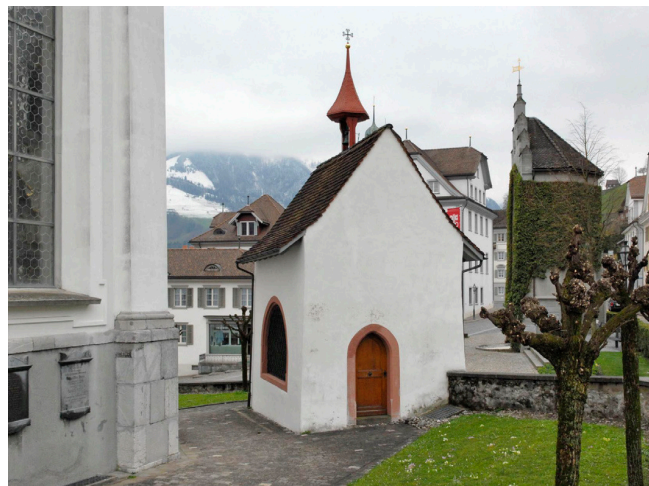
Bild oben: Ansicht von Südosten Bild unten: Ansicht von Nordwesten