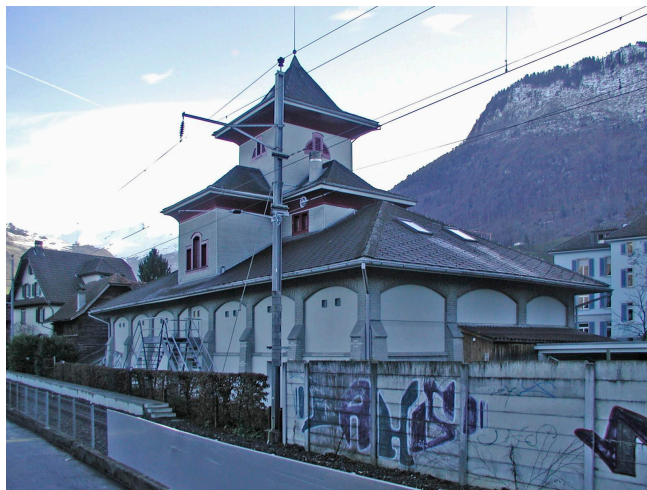
Bild oben: Ansicht von Südosten Bild unten: Ansicht von Nordosten

Eingeschossiges, queroblonges Lagergebäude unter Walmdach für die Feuerwehrtensilien. Das Erdgeschoss öffnet sich mit sieben grossen Toren gegen den Vorplatz, die aufwändig gestalteten Verdachungen der Lukarnen und des Schlauchtrocknungsturms erinnern an Pagodendächer. Mehrfach umgebaut, durch eine grössere Anbaute im Erdgeschoss an der Südostfassade erlitt der Bau grosse Veränderung. 1967 Umbau im Innern und 1973/74 Umbau Aussen durch Architekt Ernst Niederberger, Stans). 1998/99 Anbau und Umnutzung unter Architekt Waser und Achermann, Stans.