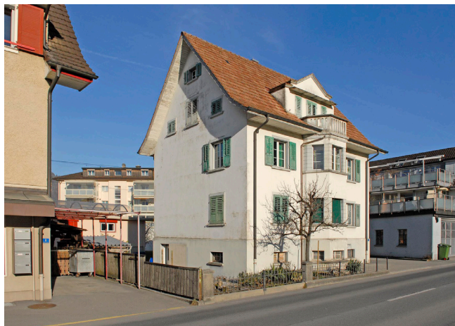
Bild oben: Ansicht von Südosten Bild unten: Ansicht von Südwesten

Traufständiges zweigeschossiges Wohnhaus unter Satteldach mit Treppenhausturm an der Ostfassade und ebenfalls polygonalem Erkerturm an der Strassenfassade, der im Dachbereich als Balkon für die Lukarne endet.