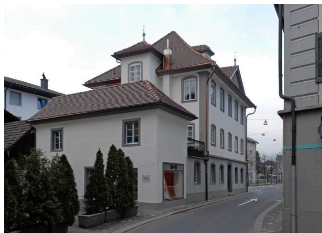
Bild oben: Ansicht von Südosten Bild unten: Ansicht von Nordwesten

Dreigeschossiges bürgerliches Haus mit Pyramidendach mit Dreiecksgiebel und kleinen Gauben. Auf jedem Geschoss verschiedenhohe Fenster, horizontale Fenstergliederung sehr regelmässig. Im Sockelgeschoss Ecksteinquader, in den Obergeschossen Pilaster. W-seitig Risalit. 2005 Aussen- und Innenrestaurierung. Zu Tellenmattstrasse 8 zugehörig.