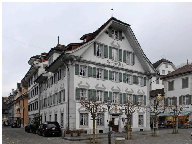
Bild oben: Ansicht von Südwesten Bild unten: Ansicht von Nordwesten

1986 grundlegender Umbau und Renovation unter Auskernung des Inneren zur Nutzungsänderung zum Hotel und Restaurant Linde.