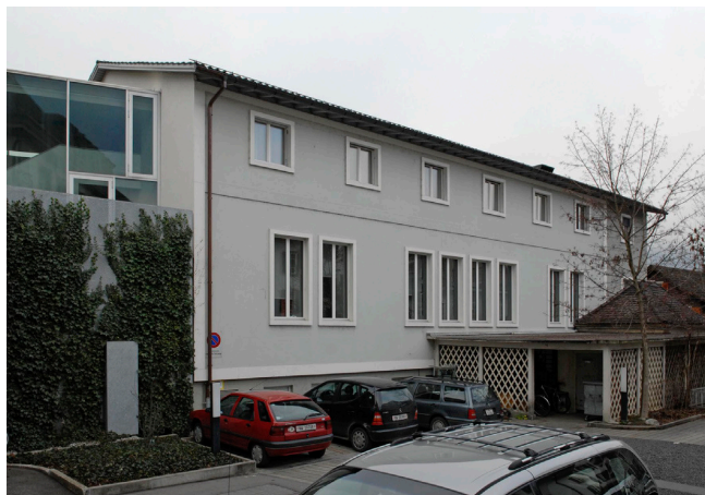
Bild oben: Ansicht von Südwesten Bild unten: Ansicht von Südosten

Der dreigeschossige Saalanbau steht unter einem flachen Satteldach. Der Sockel ist eher unscheinbar gehalten, herausstechen die hochvertikalen Fenster im Mittelteil, die auf beiden Längsseiten einen vierachsigen Mittelteil und zwei zweiachsige Seitenteile bilden.