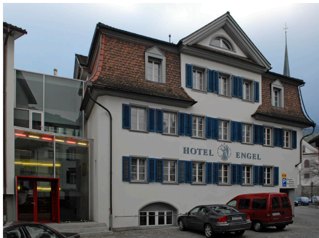
Bild oben: Ansicht von Südosten Bild unten: Ansicht von Nordwesten

Vorgängerbau um 1800 grundlegend zum Gasthaus umgestaltet. Zweigeschossig mit hohem Pyramidendach mit Mansardprägung, gewisse Ecksymmetrie des Hauptbaus. Die SW-liche Ecke des Gebäudes wurde angeschnitten und mit zwei Säulen abgestützt zur Weiterführung des Trottoirs. 1956 Saalanbau, 1989 Terrassenanbau. 2002-2003 grundlegende Renovation.