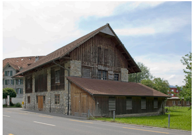
Bild oben: Ansicht von Südwesten Bild unten: Ansicht von Nordosten

Der O-lich des Hauptgebäudes liegende Gaden ist aus Bruchsteinen gemauert, im oberen Teil durch Ständerbauteile aufgelockert, wobei an der S-seite eine sehr unpassende Holzverkleidung angebracht wurde. Das gerade Satteldach über der kunstvoll gearbeiteten Dachuntersicht ist mit Falzziegeln gedeckt. O-seitig wurde ein mit Biberschwanzziegeln einfach gedeckter Pultdachanbau erstellt.