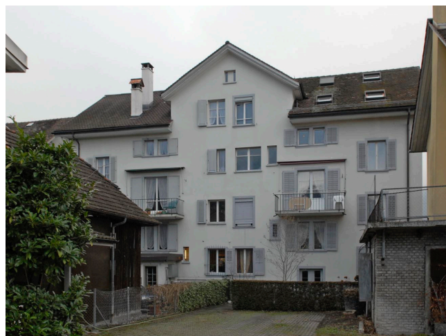
Bild oben: Ansicht von Nordwesten Bild unten: Ansicht von Südosten

Traufständiges dreigeschossiges Doppelwohnhaus unter Satteldach mit Quergiebel. Ausgebaute Ladenlokale im Erdgeschoss. 1949 Anbau des zweigeschossigen zentralen, dreiachsigen Erkers mit Balkon und Rundbogenarkade im Erdgeschoss für Othmar Vokinger-Odermatt durch Architekt Ad. Rüegg, Kriens. 1902 Erkeranbau durch Arch. Arnold Cattani, Luzern